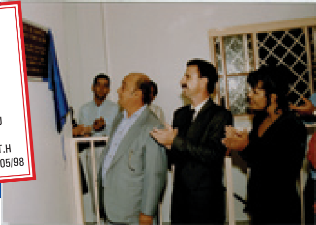
No quadro, a homenagem ao fundador do Sindicato.